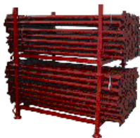
Contenitori per telai di ponteggio