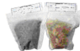
Bustine da tè (filtro)