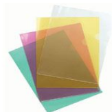
Cartellette uso ufficio –raccoltori

Capsule, contenitori in alluminio e cialde di carta per caffè, eliminate insieme al prodotto (caffè) consumato