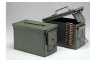
Cassette metalliche per munizioni