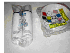
Stoviglie monouso in plastica (piatti e bicchieri) in confezioni da adibire esclusivamente ad uso domestico

Vedi procedura specifica di esenzione dal contributo ambientale per i rotoli di alluminio astucciati destinati ad uso domestico (Modulo 6.18 e relative istruzioni, Guida Conai)