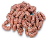
Budelli per salumi