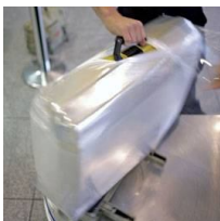
Film in plastica utilizzato per avvolgere le valigie in aeroporto