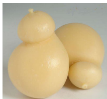
Rivestimenti di cera dei formaggi