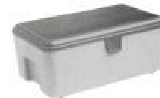
Cassette per attrezzi