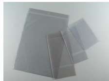
Buste porta documenti e porta cartellini