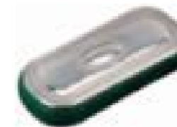
Custodie – astucci per beni durevoli (gioielli, occhiali, giochi, macchine fotografiche, etc.)