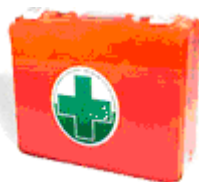
Valigetta pronto soccorso

Vedi procedura specifica di esenzione dal contributo ambientale (Modulo 6.19 e relative istruzioni, Guida Conai)