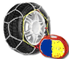
Valigette per catene da neve