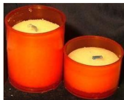
Lumini per cimitero (contenitori per candele)