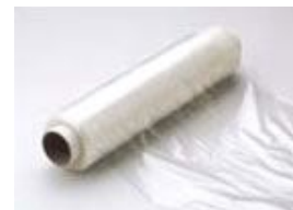
Pellicole di plastica trasparente destinate esclusivamente ad uso domestico